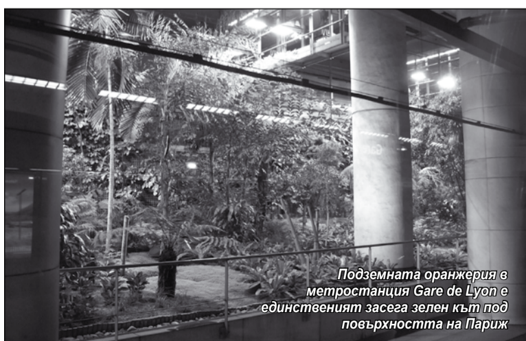
Подземната оранжерия в метростанция Gare de Lyon е единственият засега зелен кът под повърхността на Париж