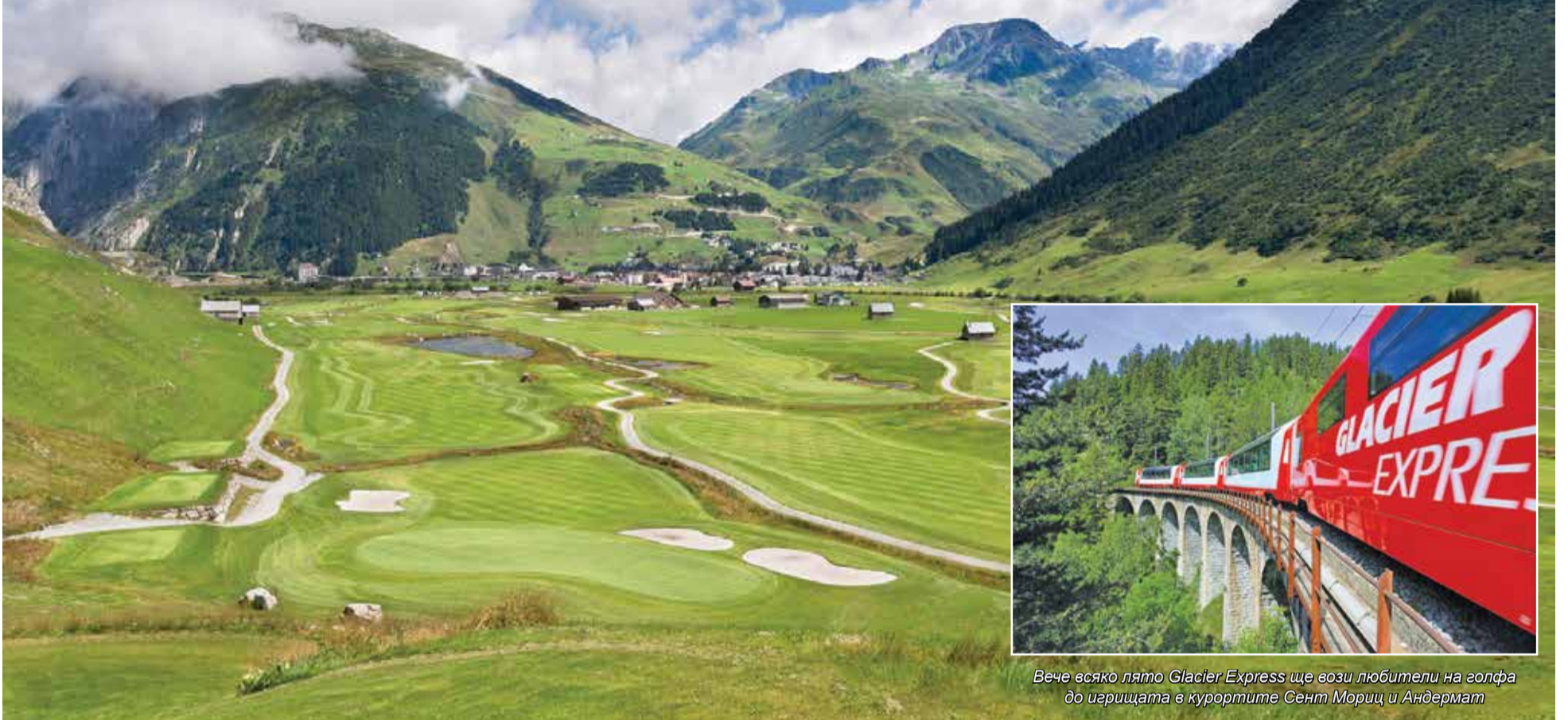
Вече всяко лято Glacier Express ще вози любители на голфа до иарищата в курортите Сент Мориц и Андермат

Известният туристически влак предлага специален воаяж за богатите любители на спорта из швейцарските Алпи