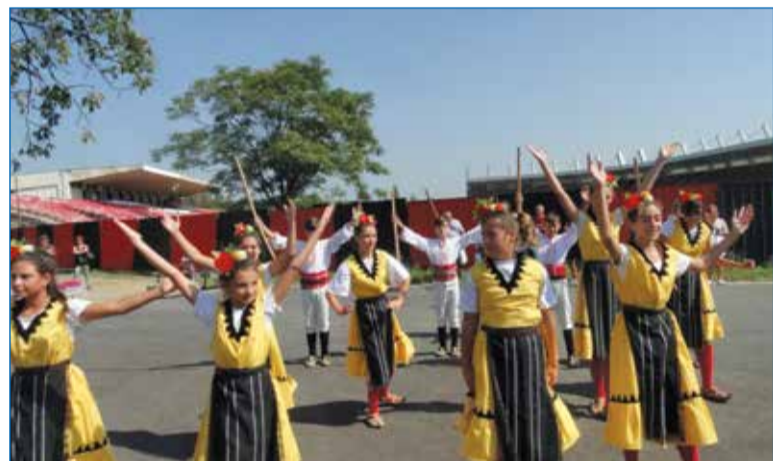
За „добре дошли“ младежки ансамбъл изпълни няколко хора като начало.