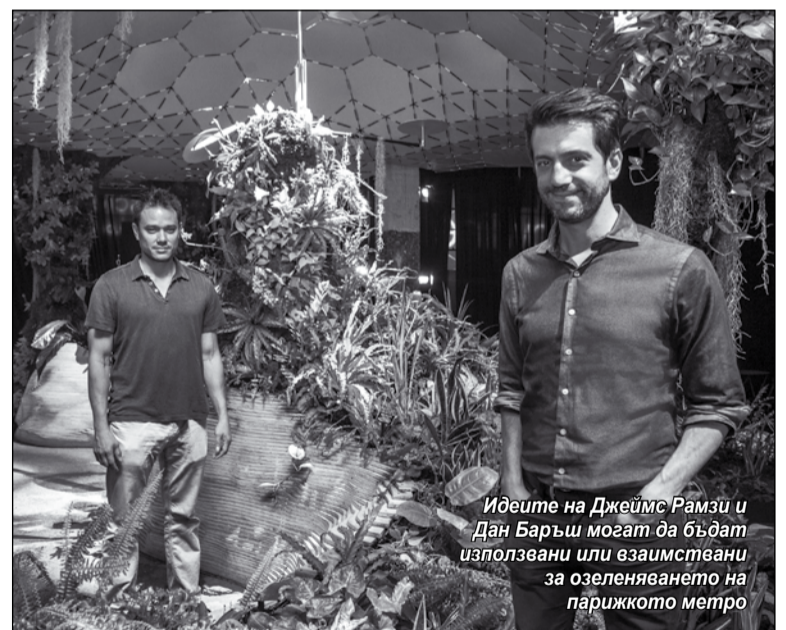
Идеите на Джеймс Рамзи и Дан Баръш могат да бъдат използвани или взимани за озеленяването на парижкото метро