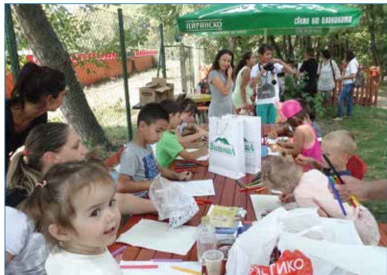
Малките художници показват творческите си умения.

Организационен комитет при „ССВУ“ и „ССЖПУ“ – Горна Оряховица организира юбилейна среща по случай