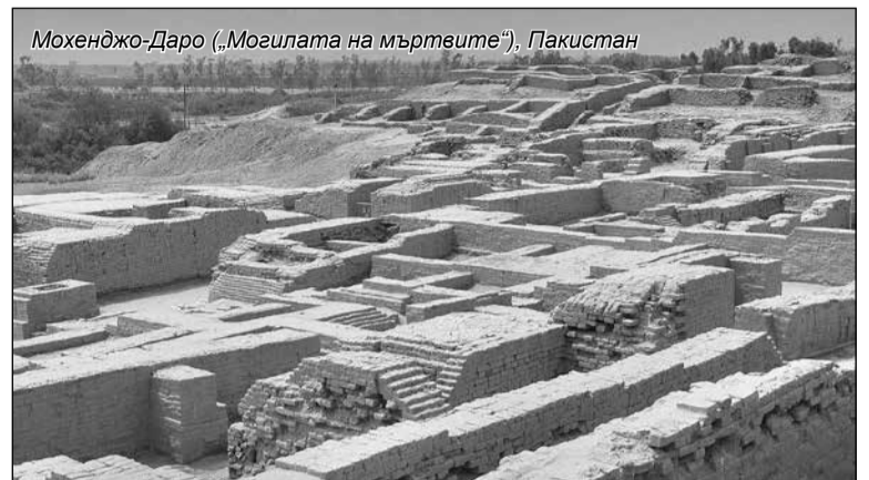
Мохенджо-Даро („Могилата на мъртвите“), Пакистан

Този археологически обект в Канада бил селище, основано от викингите преди около хиляда години. Фактът, че той съществува,