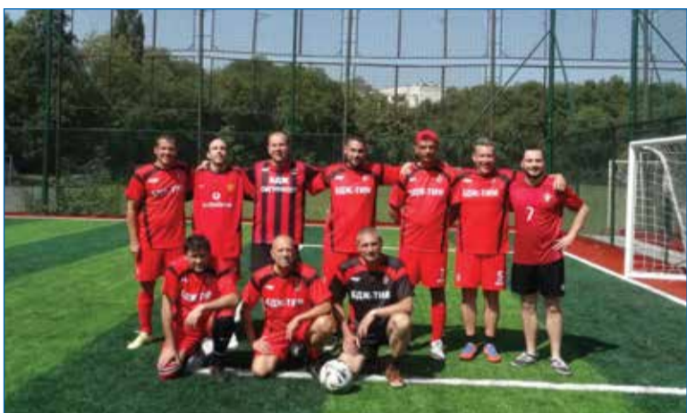
Тимът на холдинга нетърпеливо очаква да покаже на какво е способен.