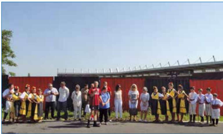
Официалните гости преди откриването.