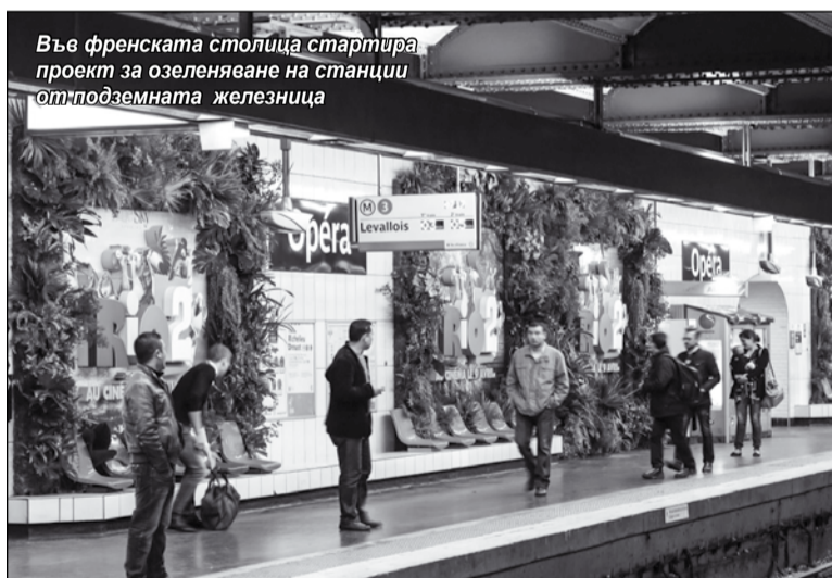
Във френската столица стартира проект за озеленяване на станции от подземната железница