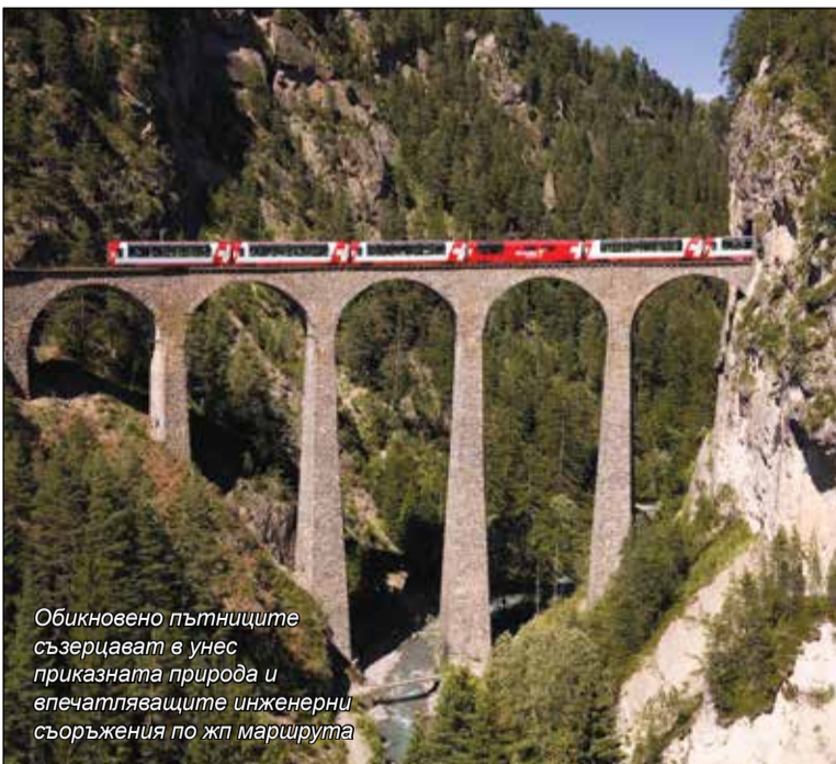
Обикновено пътниците съзерцават в унес приказната природа и впечатляващите инженерни съоръжения по жп маршрута