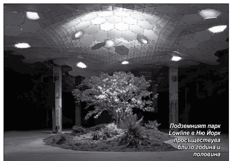
Подземният парк Lowline в Ню Йорк просъществува близо година и половина