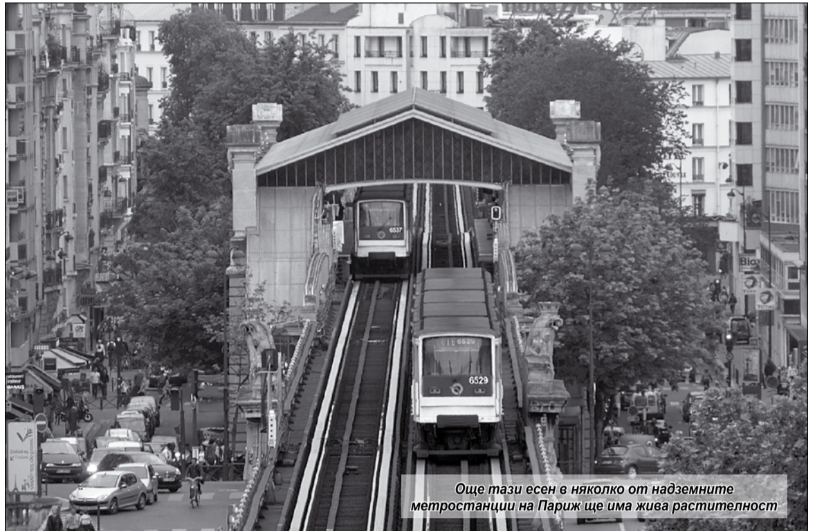
Още тази есен в няколко от надземните метростанции на Париж ще има жива растителност

Според Франк Авис, ръководител на отдел „Мултимодални услуги и пространства“ на па-