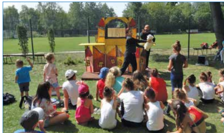
Децата искрено преживяваха съдбата на куклените герои.