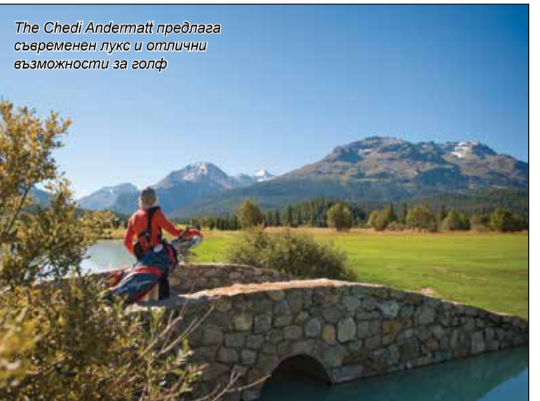
The Chedi Andermatt предлага съвременен лукс и отлични възможности за голф