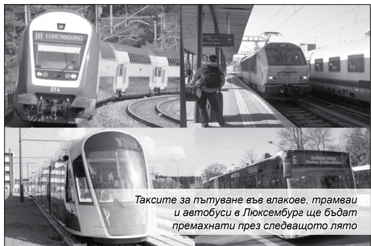
Таксите за пътуване във влакове, трамваи и автобуси в Люксембург ще бъдат премахнати през следващото лято