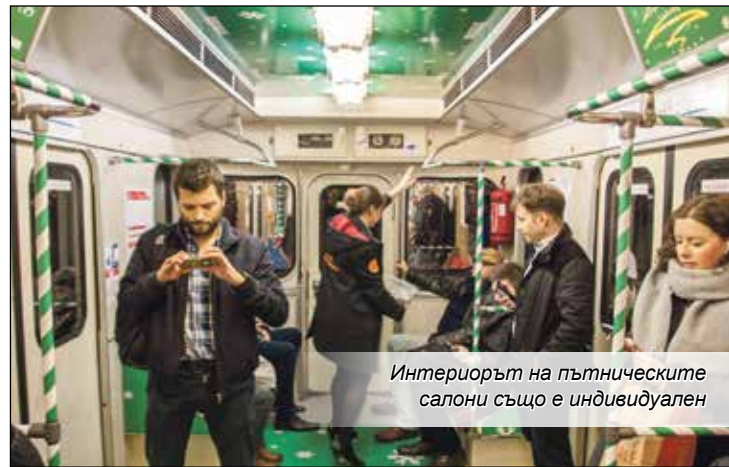
Интериорът на пътническите салони също е индивидуален