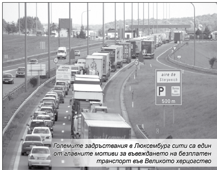
Големите задръствания в Люксембург сити са един от главните мотиви за въвеждането на безплатен транспорт във Великото херцогство

Специалистите следят развитието на проекта с интерес. Много от тях са убедени, че ако безплатният транспорт се въведе успешно във Великото херцогство, това ще намери отражение и в околните държави. Има индикации, че съседна Франция може да започне да премахва билетите за някои автобусни линии, за които превозният документ така или иначе е със символична стойност. Понастоящем хората там