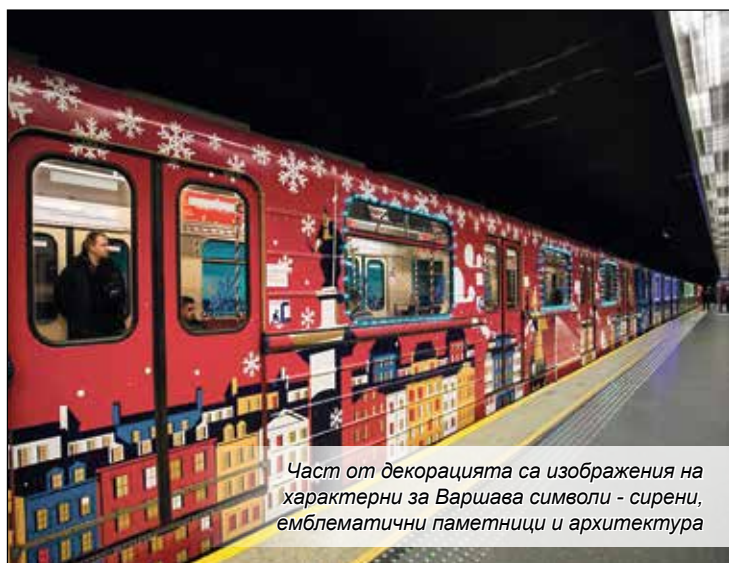
Част от декорацията са изображения на характерни за Варшава символи - сирени, емблематични паметници и архитектура