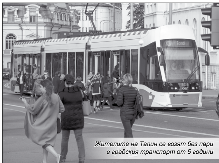
Жителите на Талин се возят без пари в градския транспорт от 5 години

имат възможност да пътуват на далечни разстояния (до и от градове като Ница и Перпинян) за абонаментна такса само от 1 евро.