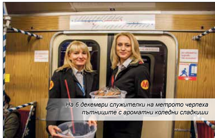
На 6 декември служителки на метрото черпеха пътниците с ароматни коледни сладкиши