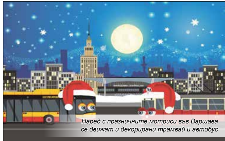
Наред с празничните мотриси във Варшава се движат и декорирани трамвай и автобус