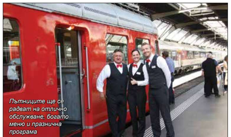
Пътниците ще се радват на отлично обслужване, богато меню и празнична програма