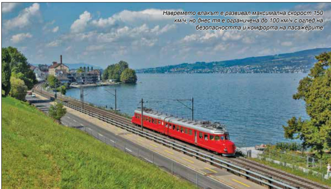
На времето влакът е развивал максимална скорост 150 км/ч, но днес тя е ограничена до 100 км/ч с оглед на безопасността и комфорта на пасажерите