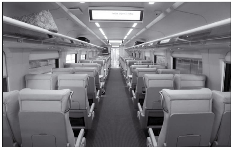
Щатските високоскоростни влакове ще предложат много комфорт и удобство на своите пасажери