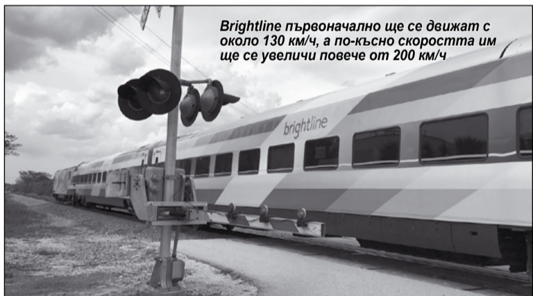
Brightline първоначално ще се движат с около 130 км/ч, а по-късно скоростта им ще се увеличи повече от 200 км/ч