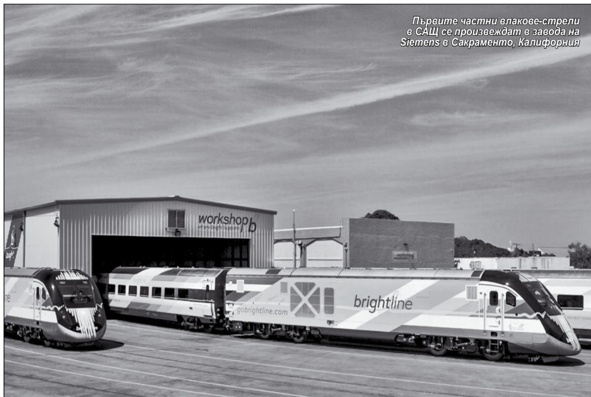
Първите частни влакове-стреми в САЩ се произвеждат в завода на Siemens в Сакраменто, Калифорния

От компанията-майка Florida East Coast Industries обръщат внимание, че техните скоростни състави са проектирани „с грижа за природата“. Всеки от тях ще се задвижва от два модерни дизел-електрически локомотива Siemens Charger. Те са снабдени с енергетична установка, която работи много по-тихо от двигателите на аналогични машини и отделя по-малко въглеродни емисии в района.