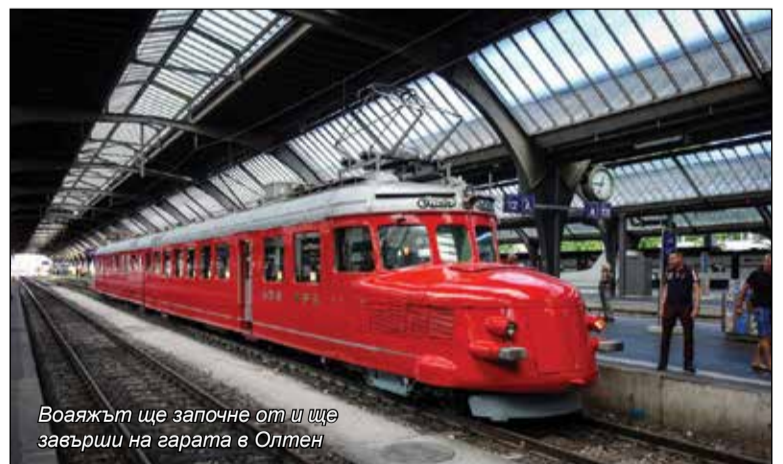
Воаяжът ще започне от и ще завърши на гарата в Олтен