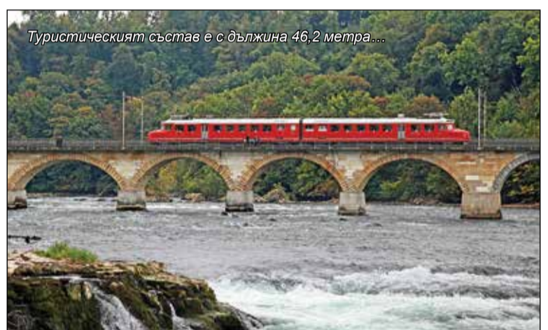
Туристическият състав е с дължина 46,2 метра...