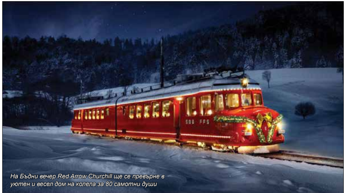
На Бъдни вечер Red Arrow Churchill ще се превърне в уютен и весел дом на колела за 80 самотни души

Детайлите на развлекателната програма на предколедния жп рейс засега се държат в тайна. Целта на SBB е да сюрпризира възможно най-приятно пасажерите. От компанията обещава още богато празнично меню от кетъринговата компания Elvetino и безплатни дневни жп билети за всеки от пасажерите, за да могат да дойдат до началната точка на пътуването.