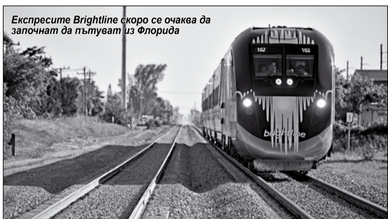
Експресите Brightline скоро се очаква да започнат да пътуват из Флорида

Специалистите са на мнение, че дори при такива ниски цени на билетите, трите милиар-