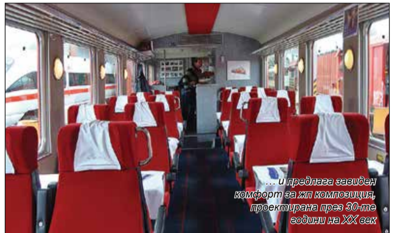
... и предлага завиден комфорт за жп композиция, проектирана през 30-те години на XX век