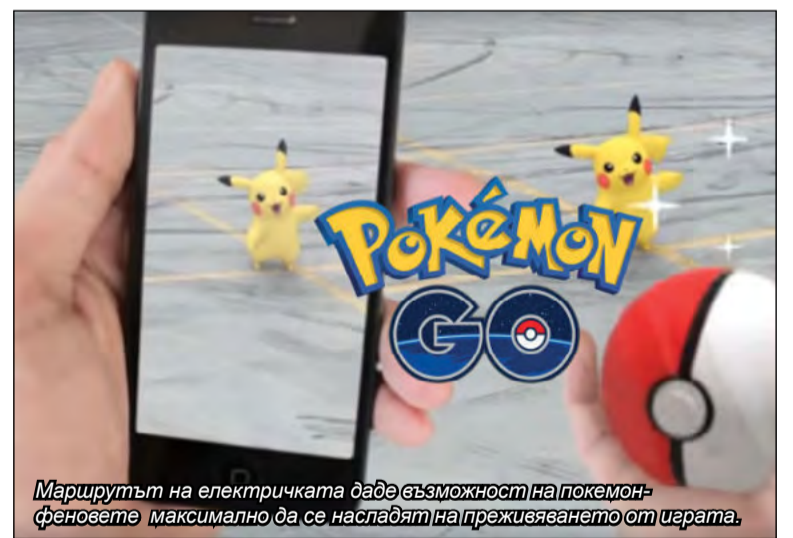
Маршрутът на електричката даде възможност на покемон-феновете максимално да се насладят на преживяването от играта.

* Rheinbahn AG управлява обществен транспорт на градовете Дюселдорф и Мербуш. Компанията обслужва 11 железопътни линии (в т.ч. частично и метрото), 7 трамвайни и 91 автобусни маршрута. Жп мрежата на оператора обхваща също градовете Нойс, Крефелд, Дуйсбург, Ратинген и е с обща дължина 342 км. Ежегодно само по нея се превозват повече от 214 млн. пътници.