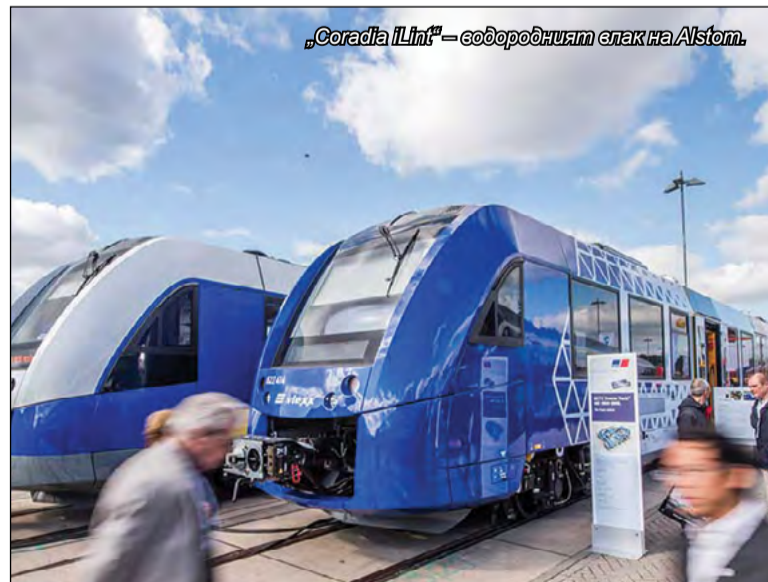
„Coradia iLint“ – водородният влак на Alstom.