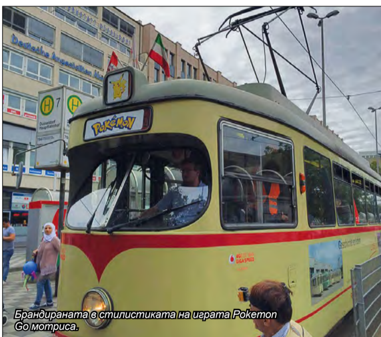
Брандираната е стилистиката на церама Pokémon Go моториса.

Докато железниците по цял свят апелираха пътниците да се откажат от хитовата мобилна игра Pokémon Go на гарите и край релсовата мрежа с оглед наличната им безопасност, транспортният оператор на Дюселдорф направи обратното. От Rheinbahn AG* - компанията за обществени превози на германския град насърчи феновете й, като пуснаха специална електричка... за лов на покемони (виртуалните чудовища, които играчите имат за цел да хванат чрез игровото приложение).