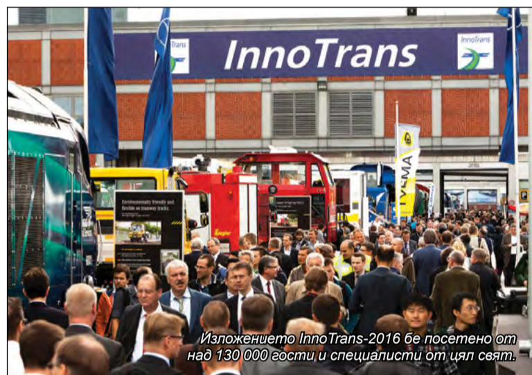
Изложението InnoTrans-2016 бе посетено от над 130 000 гости и специалисти от цял свят.

и с душ. Комфортът на пасажерите се допълва от съвременни информационна и климатична системи. Освен това всеки вагон е снабден с агрегат за аварийно електрозахранване, който гарантира автономната работа на отопление, охлаждане и осветление в продължение на 24 часа при липса на подаване на енергия от локомотива.