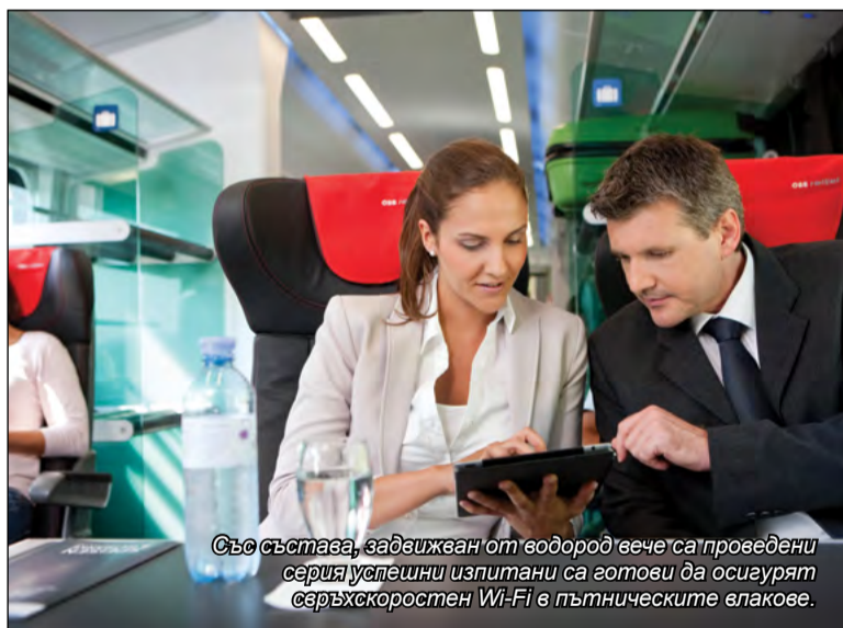
Със състава, задвижван от водород вече са проведени серия успешни изпитания са готови да осигурят свръхскоростен Wi-Fi в пътническите влакове.

* Изложението InnoTrans се провежда веднъж на всеки две години от 1996 г. Експозицията включва пет сегмента: Railway Technology (железопътни технологии), Railway Infrastructure (железопътна инфраструктура), Public Transport (обществен транспорт), Interiors (вътрешно оборудване) и Tunnel Construction (конструкции за тунелно строителство).