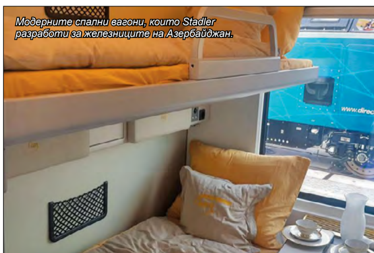
Модерните спални вагони, които Stadler разработи за железниците на Азербайджан.