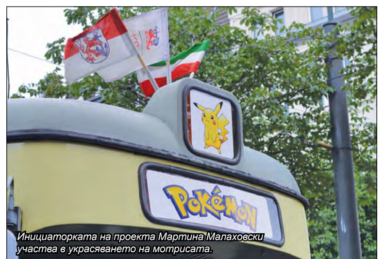
Инициаторката на проекта Мартина Малаховски участва в украсяването на моторисата.