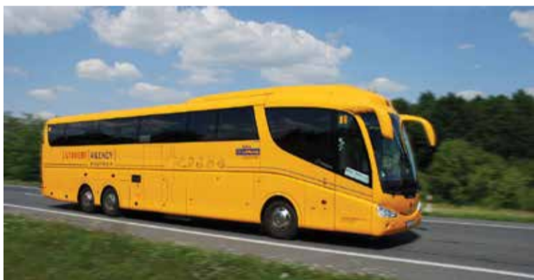
Автобусната мрежа на Student Agency и RegioJet обхваща територията на Чехия и Словакия

товарените за 2014 г. бяха Харьков – Конотоп – Суми (средна запълняемост на влаковете – 22 процента), Запорожие – Бердянск (22 – 23 процента) и Суми – Харьков (33 процента).