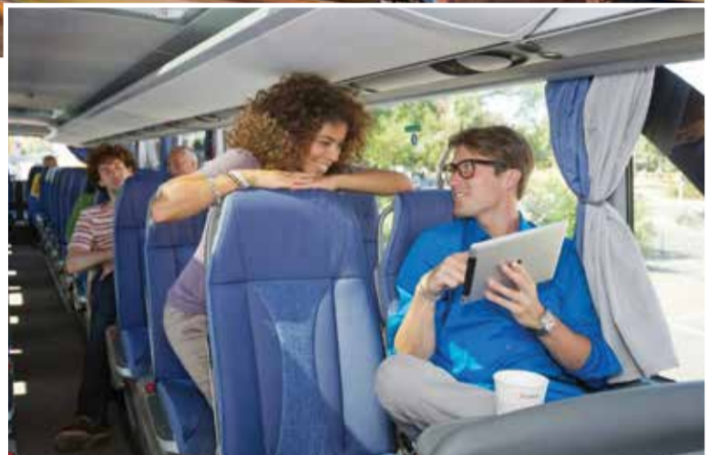
Водещите железници купуват модерни и комфортни автобуси и това се нрави на пасажерите

Аналогична услуга – iDBUS – предлагат на своите клиенти и френските държавни железници (SNCF) от юли 2012 г. За разлика от Deutsche Bahn френският монополист предлага повече маршрути – 13, но те обхващат само 6 страни (Великобритания, Холандия, Белгия, Германия, Италия и Испания). Превозите в северното направление се осъществяват от Париж, а в южното