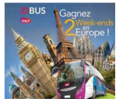
Свои автобусни превози – iDBUS – предлагат и френските железници

Другата услуга – ÖBB Postbus – е малко по-различна. Тя е свързана с т.нар. „пощенски автобуси“, които пътуват в Австрия от 1907 г. Те свързват провинциите с големите гра-