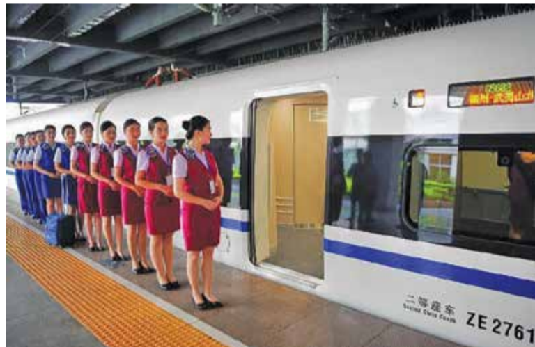
Заучаването на стойки и жестове е част от обучението...