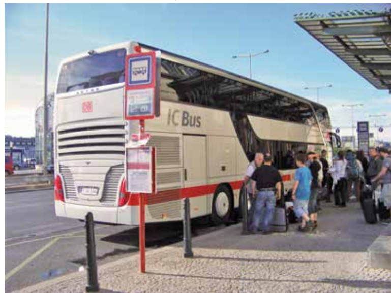
Услугата IC Bus на Deutsche Bahn е пусната през януари 2013 г.

За германските железници Deutsche Bahn може да се каже, че са творец на тенденции в релсовия транспорт. Те са съсредоточили своето внимание не само върху влаковете, но и върху другите видове транспорт – автобусите и дори велосипедите. Вече няколко години Deutsche Bahn предлага услугата IC Bus. Тя дава възможност на клиентите на компанията да се възползват по определени маршрути от автобуси, а не от влакове. Отличителната черта на въпросния сервиз е, че предлага автобус-