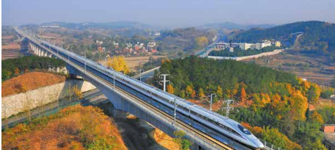
Линията Хефей – Фуджоу е смятана за най-красивата скоростна железница в Китай

Неотдавна бе демонстрирано публично какви нормативи трябва да покриват момичетата, желязници да стават жп стюардеси. Това стана по време на тържествената церемония за откриване на поредната китайска скоростна жп магистрала – Хефей – Фуджоу (с дължина 806 км). Това е първото високоскоростно трасе (позволяващо движение до 300 км/ч), което свързва