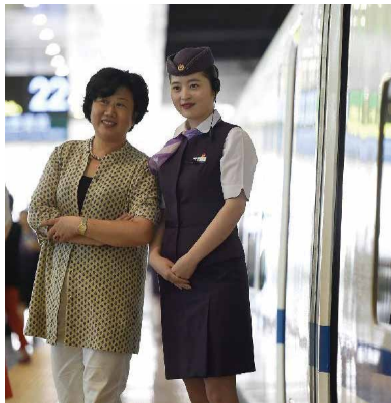
Професията е изключително престижна и много пътници си правят снимки за спомен с жп красавиците