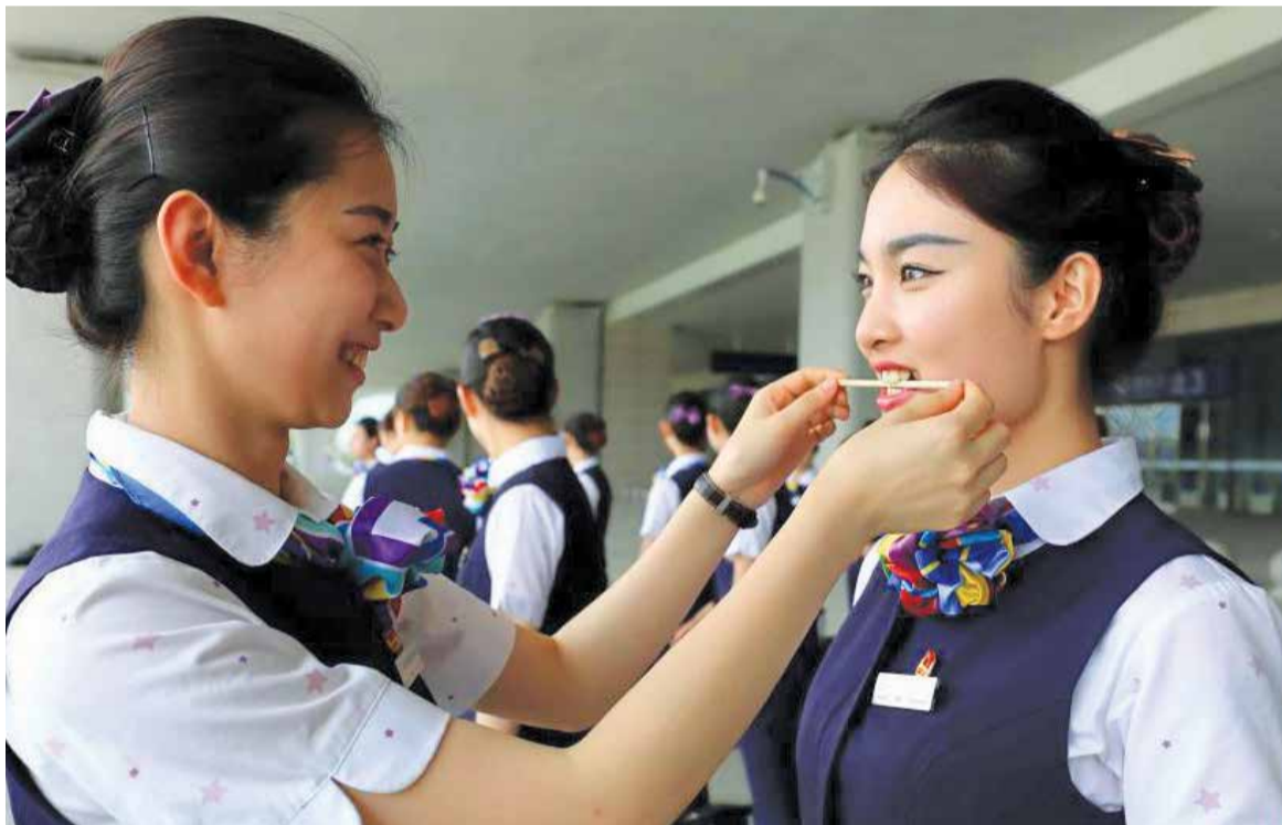
Така стюардесите тренират „правилна“ усмивка