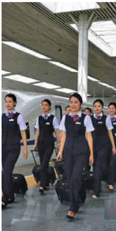
От момичетата се изисква не само плетелност, но и поведение и умения, които да будят възхищение

столиците на провинциите Анхуй и Фудзиен, преминавайки през редица планински райони помежду им (85 на сто от жп линията минава през тунели и мостове). То е наречено най-красивата скоростна железница в Китай, тъй като направлението има редица популярни за туристите природни забележителности.