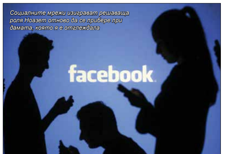
Социалните мрежи изиграват решаваща роля Ноазет отново да се прибере при дамата, която я е отглеждала