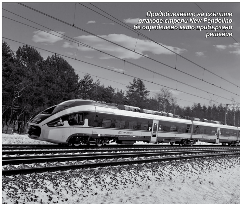
Придобиването на скъпите влакове-стреми New Pendolino бе определено като прибръзано решение