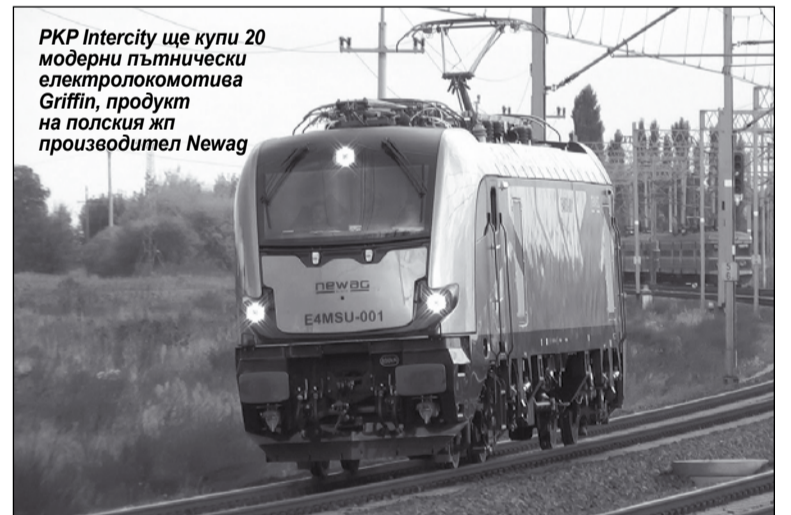
РКР Intercity ще купи 20 модерни пътнически електролокомотива Griffin, продукт на полския жп производител Newag

рани с около два пъти по-малко, само по 26 млн. души на година.