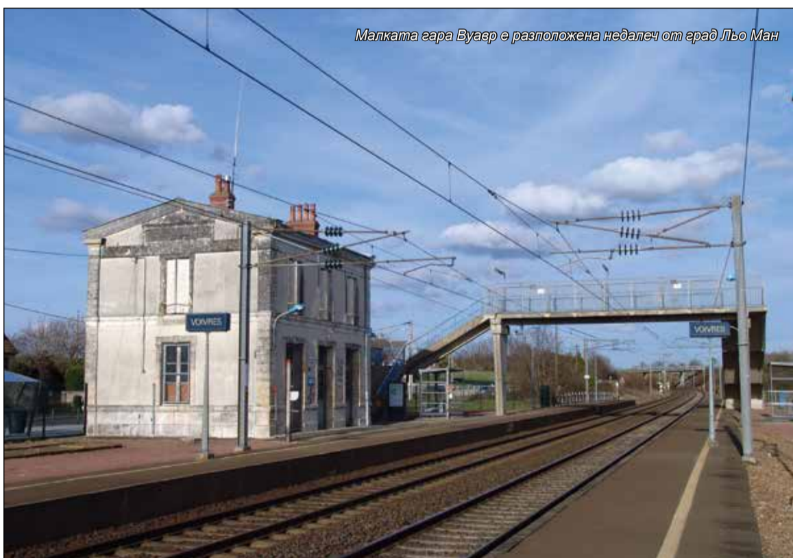
Малката гара Вуавр е разположена недалеч от град Льо Ман