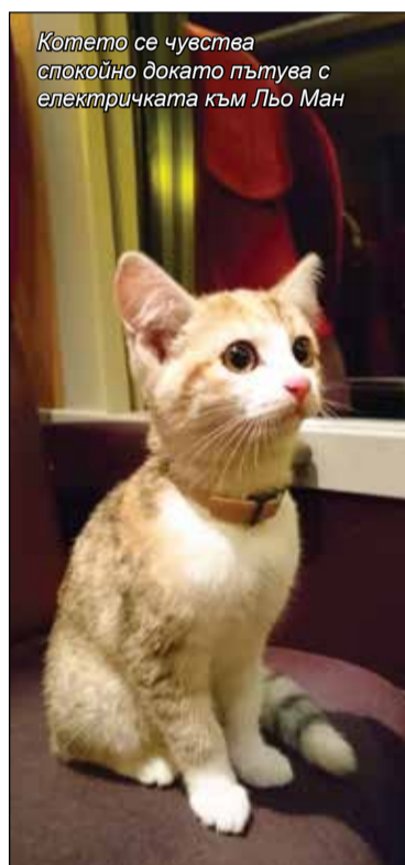
Котето се чувства спокойно докато пътува с електричката към Льо Ман