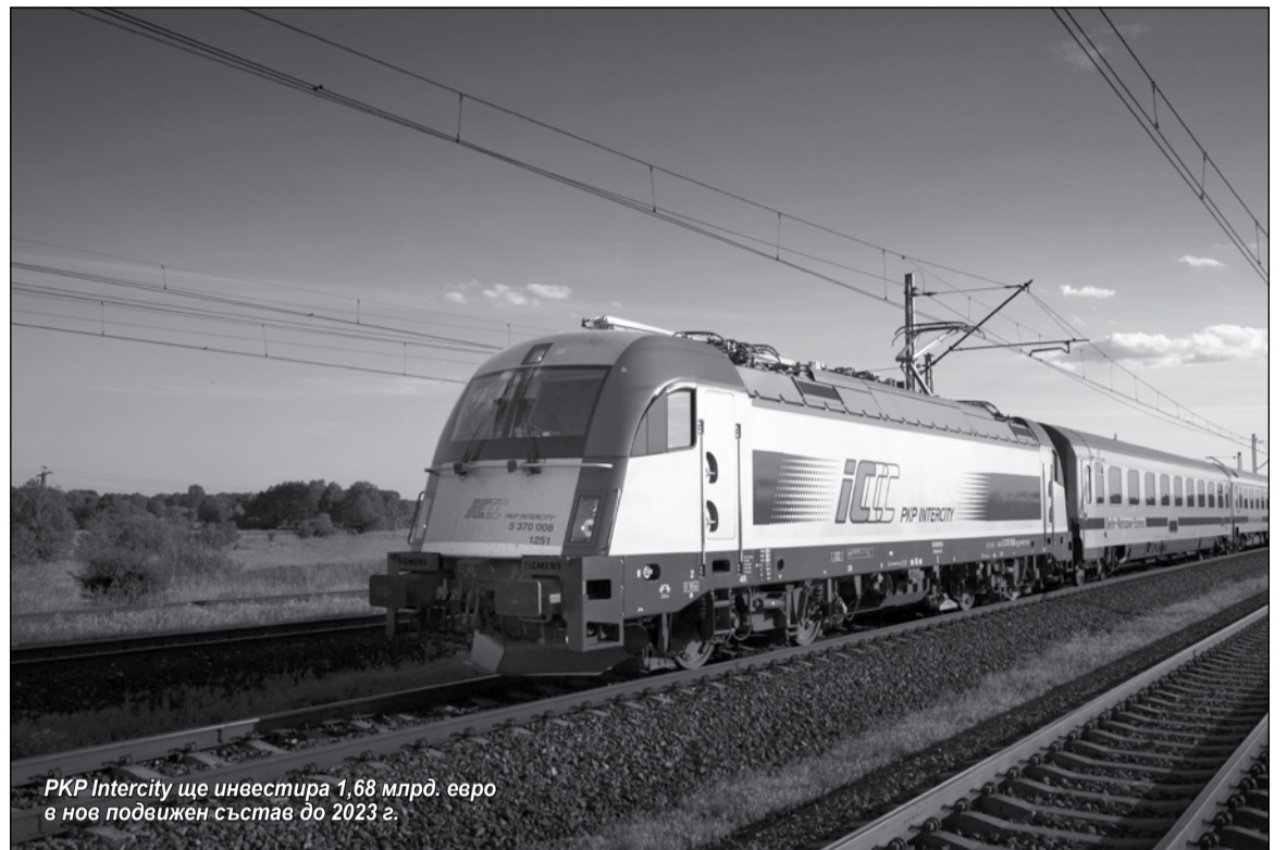
РКР Intercity ще инвестира 1,68 млрд. евро в нов подвижен състав до 2023 г.

РКР Intercity тепърва предстои да дава ход и на други търговски процедури. Операторът започна сътрудничество с Националния научно-изследователски център на страната в рамките на три проекта. По тях се разработват локомотиви и друг подвижен състав от ново поколение, които трябва да отговарят на определени експлоатационни изисквания. Тендерите за техниката ще се проведат след съгласуване и уточняване на всички технически