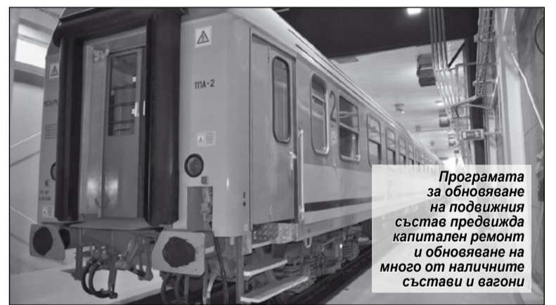
Програмата за обновяване на подвижния състав предвижда капитален ремонт и обновяване на много от наличните състави и вагони

Чрез повишаването на комфорта на своите клиенти РКР Intercity се стреми да съхрани тенденцията, наблюдавана от 2014 г. за постепенно увеличаване на броя им. През 2018 г. компанията очаква да превозва 41 млн. пасажери. За сравнение, 4 години по-рано са транспорти-