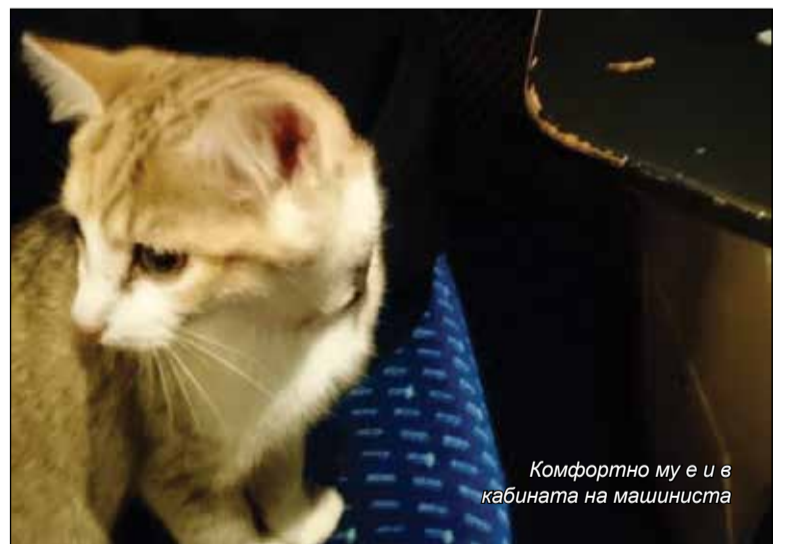
Комфортно му е и в кабината на машиниста