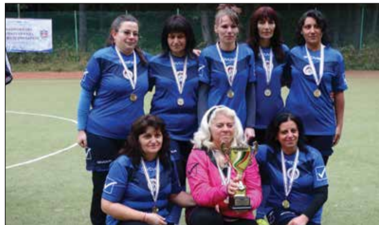
Горна Оряховица пак грабна купата.