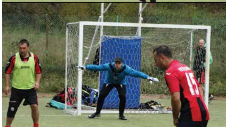
Не е лесно да парираш топката на конкуренцията.