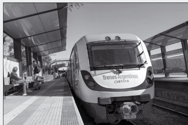
Страницата подготви: Ивайло ПАШОВ

Правителството на Аржентина настоява още 20 на сто от компонентите на новите влакове – в т.ч. алуминиевите корпуси на вагоните, пътническите седалки, вратите и климатичната система – да се произведат от местната промишленост. Това е условие, което предполага около 300 млн. долара допълнителни инвестиции и разкриването на 2000 работни места.