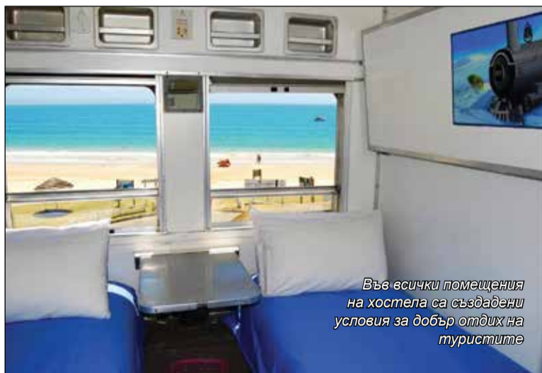
Във всички помещения на хостела са създадени условия за добър отдих на туристите

ва да очаквате особен лукс. Така например, от управата на Santos Express предупреждават, че се предоставя само спално бельо, но не и кърпи – затова трябва да си носите. Забележителната чистота в помещенията на хотела, отзивчивостта и приятелското отношение на персонала обаче са гарантирани. Complimenti за тях се споделят в коментарите на не един и два популярни сайта за резервации.