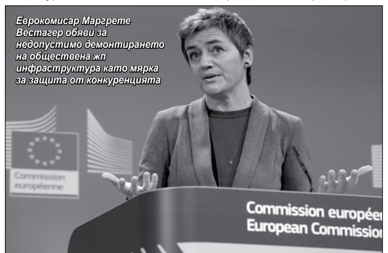
Еврокомисар Маргрете Вестагер обяви за недопустимо демонтирането на обществена жп инфраструктура като мярка за защита от конкуренцията