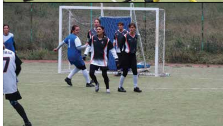
Жените безспорно показаха стил, скъсал с аматьорството.

номер, ако той разбира се не е даден. Такъв прецедент вече има – два от екипите са притежание на напуснали колеги. С единия бившият български железничар вече участва в местни състезания на Англия, където от