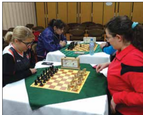
Турнирът този път е значително по-напрегнат и оспорван и при мъжете, и при жените.