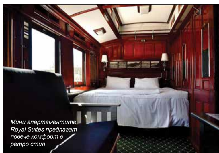
Мини апартаментите Royal Suites предлагат повече комфорт в ретро стил

За такива смешни (дори по родните стандарти) пари не трябва