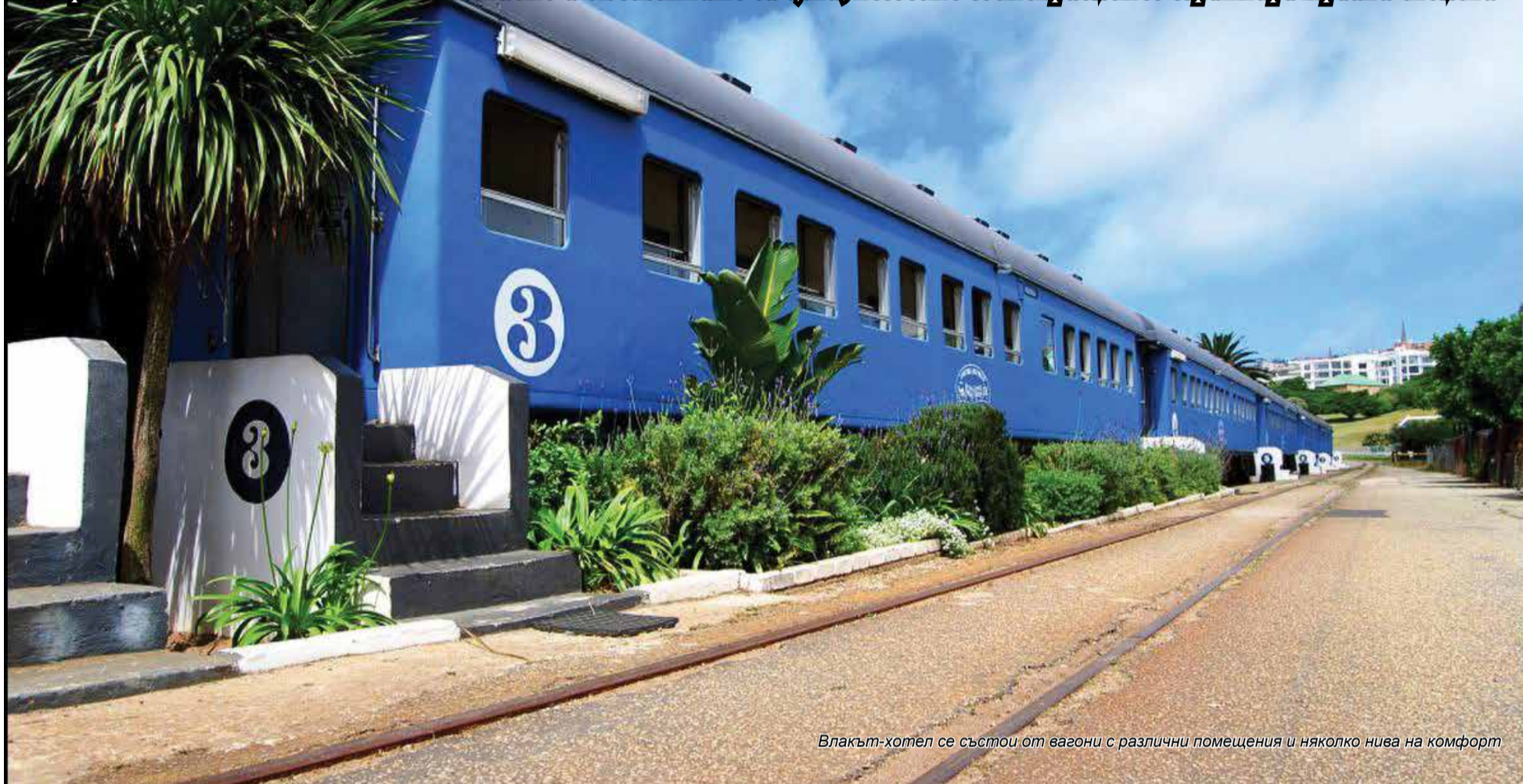
Влакът-хотел се състои от вагони с различни помещения и няколко нива на комфорт

Атрактивен с визията, местоположението и бюджетните си цени, неговото гостоприемство гарантира трайни спомени