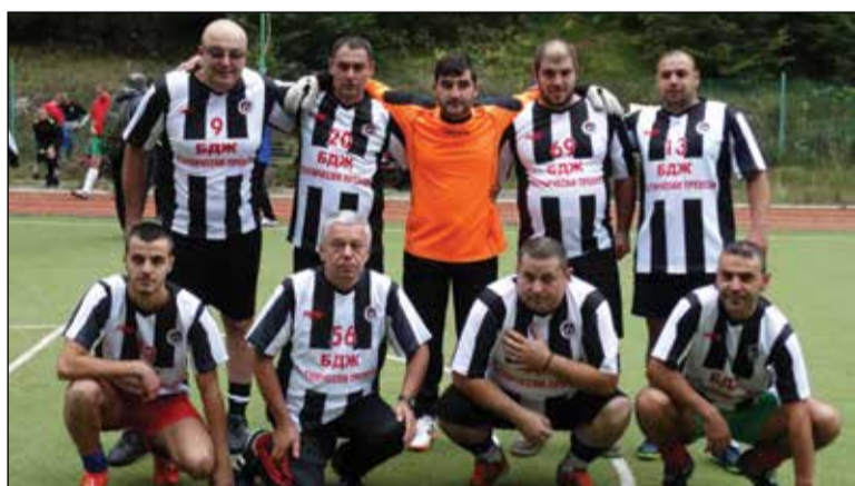
Отборът „Баба меца“ успя да утвърди духа на приемствеността и колегиалната взаимопомощ.