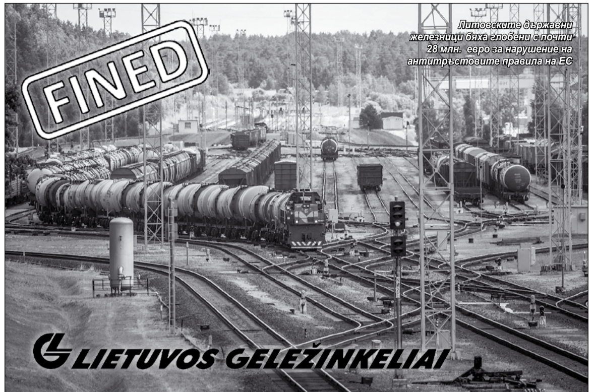
Литовските държавни железници бяха глобени с почти 28 млн. евро за нарушение на анти-тръстовите правила на ЕС

Според правилата на ЕС нарушаването на регламентите за конкуренцията могат да се санкционират с глоба в размер на до 10 процента от оборота на виновната компания за последната година. Тъй като доходите от превоза на товари на Lietuvos Geležinkeliai за 2016 г. съставляват 350,4 млн. евро, това означава, че максималната глоба, която може да бъде постановена на превозвача е