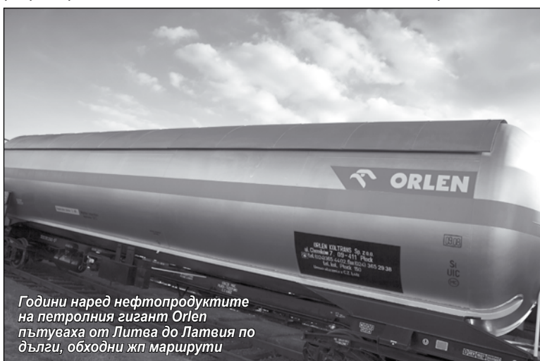
Година наред нефтопродуктите на петролния гигант Orlen пътуваха от Литва до Латвия по дълги, обходни жп маршрути

* Член 102 от Договора за функционирането на Европейския съюз (ДФЕС) забранява злоупотребата с господстващо положение на пазара, което може да засегне търговията между държавите-членки на ЕС и да предотврати или ограничи конкуренцията. Анти-тръстовият регламент (Регламент № 1/2003 на Съвета) определя как Комисията и националните органи за защита на конкуренцията прилагат тази разпоредба.