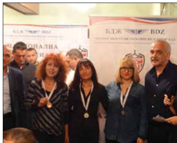
Индивидуалните медалистите в леката атлетика.