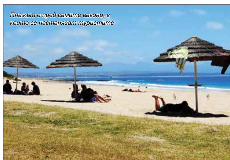
Плажът е пред самите вагони, в които се настаняват туристите